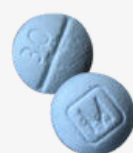
AUTHENTIC oxycodone m30 tablets*

Fake prescription pills are easily accessible and often sold on social media and e-commerce platforms making them available to anyone with a smartphone, including minors.