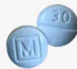
FAKE oxycodone m30 tablets*